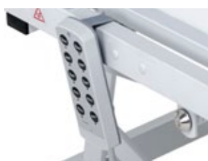
Comando do Paciente / Patient's command / Commande du patient / Mando de paciente;