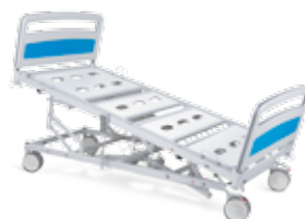
Anti-trendelenburg - 14,1°