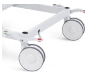
Roda com Travão Central / Wheel with Central Brake / Roue avec frein centrale / Rueda con Freno Central;