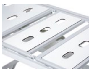
Leito em Compacto Fenólico / Bed in compact Phenolic / Lit en compact Phénolique / Lecho en Fenólico;