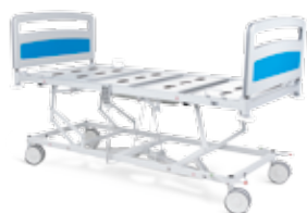
Altura máxima / Maximum height / Hauteur maximale / Altura máxima – 780mm;