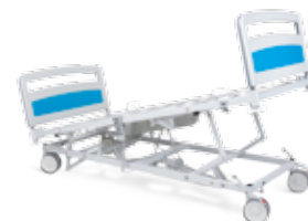
Trendelenburg - 16,0°