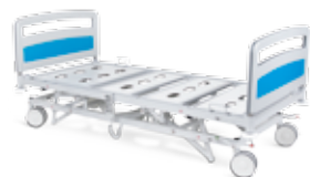
Altura mínima / Minimum height / Hauteur minimale / Altura mínima – 400mm;